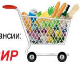
График работы - 2/2 оформление по ТК РФ, бесплатное питание, мед. осмотр, обучение на рабочем месте, оплачиваемые подработки, спец. одежда, развозка на такси, лояльный руководитель, дружный коллектив.